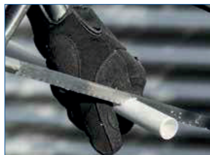
Schritt 1: schneiden