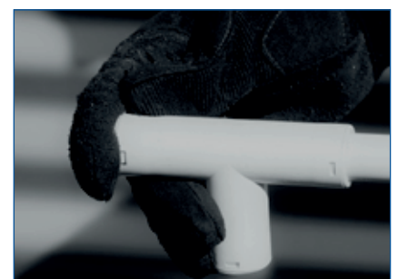
Schritt 4: verbinden