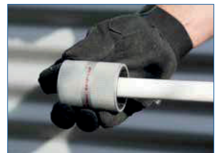
Schritt 2: Entgraten/Abschrägen