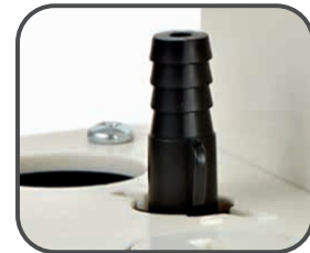
Rückschlagventil - ohne Werkzeug demontierbar / montierbar