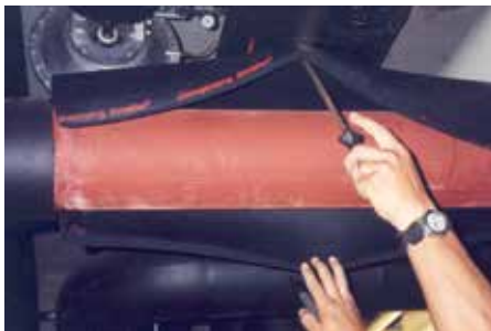
Eine der ersten AF/ArmaFlex Installationen und noch immer in Betrieb.